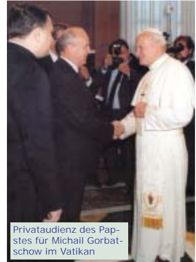
Privataudienz des Papstes für Michail Gorbatschow im Vatikan