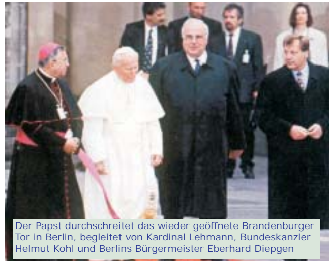
Der Papst durchschreitet das wieder geöffnete Brandenburger Tor in Berlin, begleitet von Kardinal Lehmann, Bundeskanzler Helmut Kohl und Berlins Bürgermeister Eberhard Diepgen