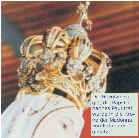
Die Revolverkugel, die Papst Johannes Paul traf, wurde in die Krone der Madonna von Fatima eingesetzt.