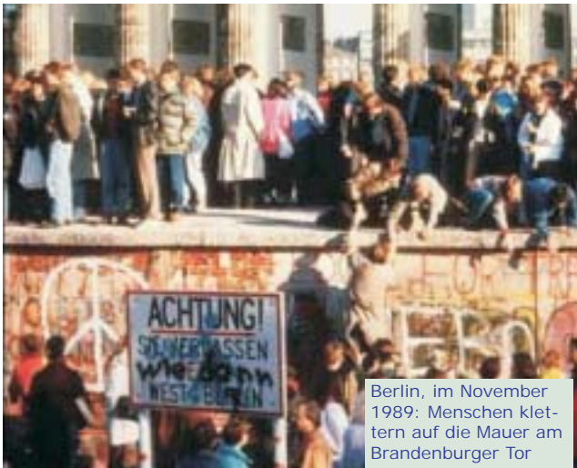
Berlin, im November 1989: Menschen klettern auf die Mauer am Brandenburger Tor