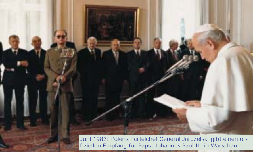
Juni 1983: Polens Parteichef General Jaruzelski gibt einen offiziellen Empfang für Papst Johannes Paul II. in Warschau