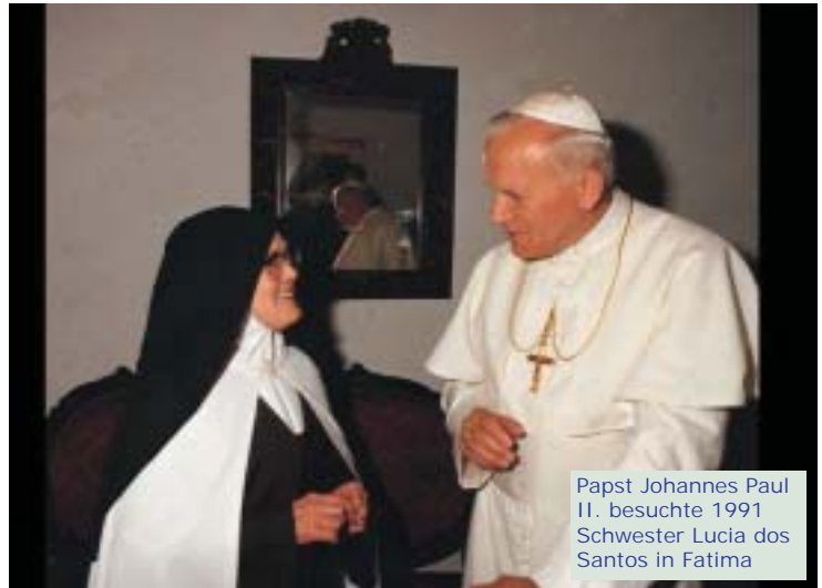
Papst Johannes Paul II. besuchte 1991 Schwester Lucia dos Santos in Fatima

nicht nur im kirchlichen, sondern auch im weltpolitischen Sinn. Es muß betont werden, daß die Punkte dieses Programms nicht streng chronologisch aufzufassen sind. Jeder Papst, der seit 1917 im Vatikan amtierte, hätte theoretisch die Möglichkeit gehabt, Rußland zur katholischen Kirche zurückzuführen und damit die Zeitschleife abzuschließen. Dadurch hätten eventuell einige schlimme Ereignisse in der Weltgeschichte des 20. Jahrhunderts verhindert werden können. Der Papst, der diese Aufgabe in Angriff nehmen konnte, mußte allerdings einige Voraussetzungen erfüllen, die im dritten Geheimnis von Fatima genau festgelegt sind. Deshalb durfte Schwester Lucia das dritte Geheimnis auch nur dem Papst offenbaren, und deshalb hatten drei Päpste vor Johannes Paul II. die Botschaft „nach Kenntnisnahme“ wieder zurückgehen lassen. Sie erfüllten diese Voraussetzungen nicht. Man muß in diesem Zusammenhang einige wichtige Punkte beachten: